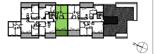
PLAN DE VENTE