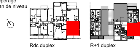
Repérage Plan de niveau